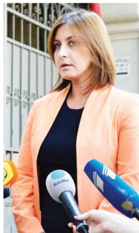
გაგრძელება 3-ე გვერდზე

მაღზე მნიშვნელოვანია, არსებობდეს საჯარო დაწესებულება, რომელიც პასუხისმგებელი იქნება მონაცემების მაკონტროლებელთა ზედამხედველობაზე, სუბიექტის უფლებების შესახებ ინფორმაციის დაცვაზე და მონაცემთა დაცვასთან მიმართებით ცნობიერების ამაღლებაზე. გარდა ამისა, ასეთი ორგანოს ჩამოყალიბება პასუხობს საქართველოს მიერ საერთაშორისო დონეზე ნაკისრ ვალდებულებებს, როგორიცაა ევროსაბჭოს (CoE) 108-ე კონვენცია და მისი დამატებითი ოქმები, ვიზალიბერალიზაციის სამოქმედო გეგმა (VLAP) და საქართველო-ევროკავშირის შორის ხელმოწერილი ასოცირების ხელშეკრულება.