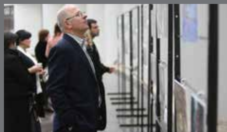
Photo exhibitions of selected works of Georgian photographers organised in different locations of the campaign events in Tbilisi and Kutaisi. The topics of the photos focused on EU-Georgia relations and migration.

An international conference entitled "ENIGMMA International Conference - Achievements of VLAP Implementation in Georgia". EU and Georgian experts gave presentations on the Eastern Partnership, VLAP implementation in Georgia and other topics, followed by a discussion on Georgia's expectations for the Riga Summit.